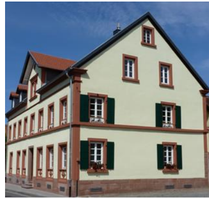
Steinwenden: Objektgerechte Dach- und Fassadensanierung