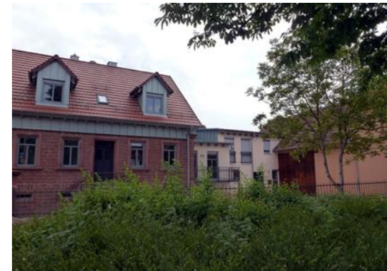
Mackebach: Umbau, Ausbau und Erweiterung ortsbildprägender Gebäude