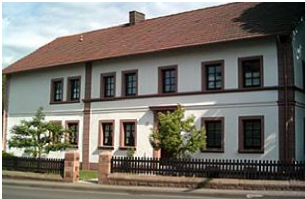
Spesbach: Objektgerechte Fassadensanierung eines landwirtschaftlich geprägten Anwesens