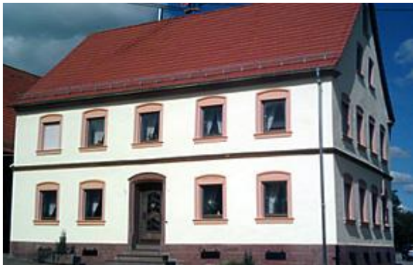
Mittelbrunn: Objektgerechte Dach- und Fassadensanierung