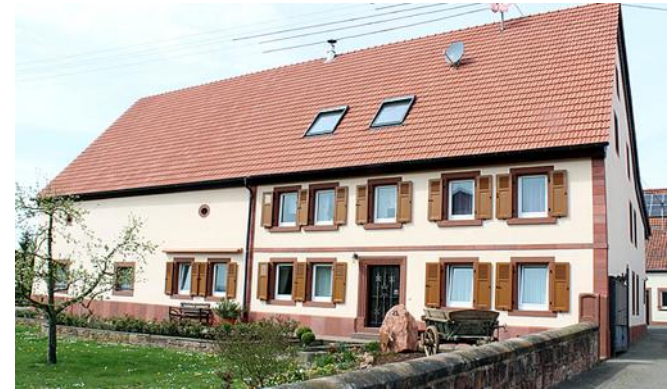
Katzenbach: Objektgerechte Fassadensanierung eines landwirtschaftlich geprägten Anwesens