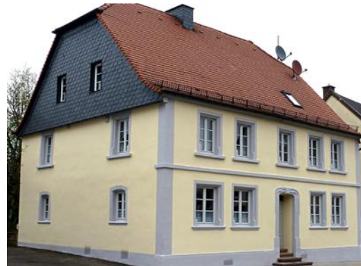
Steinwenden: Objektgerechte Fassadensanierung