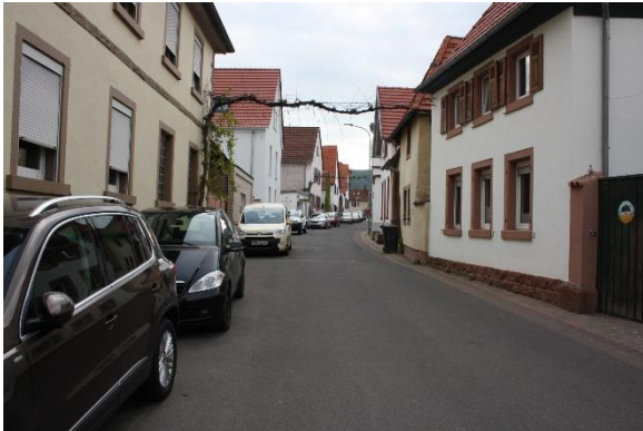
Parksituation Weyherer Straße

In der Weyherer Straße wird das Parken außerhalb zugelassener Parkbereiche wie z.B. vor Hofeinfahrten kritisiert, wodurch im Begegnungsfall sich entgegenkommende Fahrzeuge teilweise keine Möglichkeit des Einscherens mehr haben.