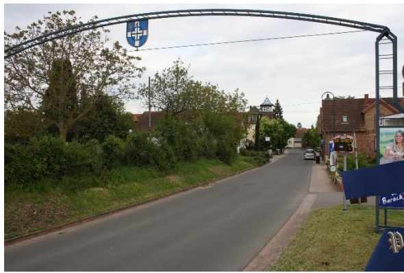
Ortseingang von Rhodt kommend

Die AG-Mitglieder monieren die Verkehrssituation am Ortseingang von Rhodt kommend (zu hohe Geschwindigkeiten sowohl Ortstein- und auswärts).