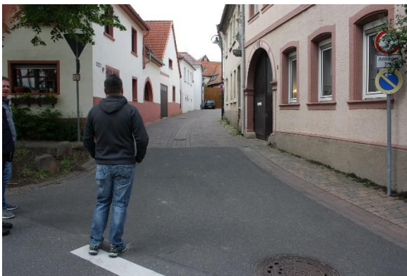
Straßenführung Weinstraße/ Hohlgasse

Schon in der ersten AG-Sitzung wurde die Straßenführung im Bereich Weinstraße/Hohlgasse angesprochen (siehe Protokoll 1. Sitzung AG Verkehr). Ein Großteil der anwesenden AG-Mitglieder sowie Hr. Poth sehen hinsichtlich der Straßenführung keinen Handlungsbedarf. Hr. Fromm von der hiesigen Feuerwehr berichtet des Weiteren über Probleme der Feuerwehr bei der Durchfahrt, aufgrund wiederrechtlich parkender Fahrzeuge in der Hohlgasse.