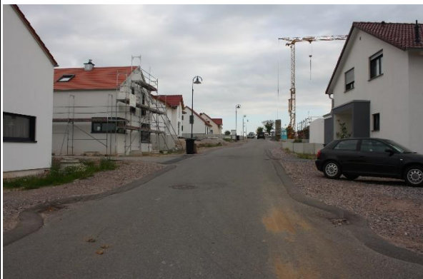
Verkehrsberuhigter Bereich Neubaugebiet „Im Pflaumen“

Im Neubaugebiet werden der hohe Durchgangsverkehr sowie das zu schnelle Fahren moniert.