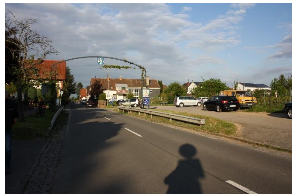
Ortseingang von Burrweiler kommend

Wie am Ortseingang von Rhodt kommend, wird auch in diesem Bereich die Geschwindigkeit der ein- und ausfahrenden Fahrzeuge seitens der Anwesenden kritisiert.