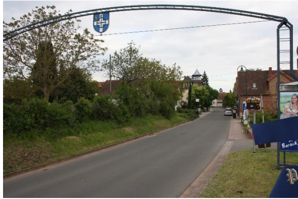
Ortseingang von Rhodt kommend

Die AG-Mitglieder monieren die Verkehrssituation am Ortseingang von Rhodt kommend (zu hohe Geschwindigkeiten sowohl Ortstein- und auswärts).